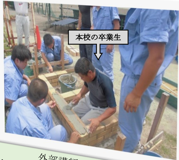
外部講師による実習