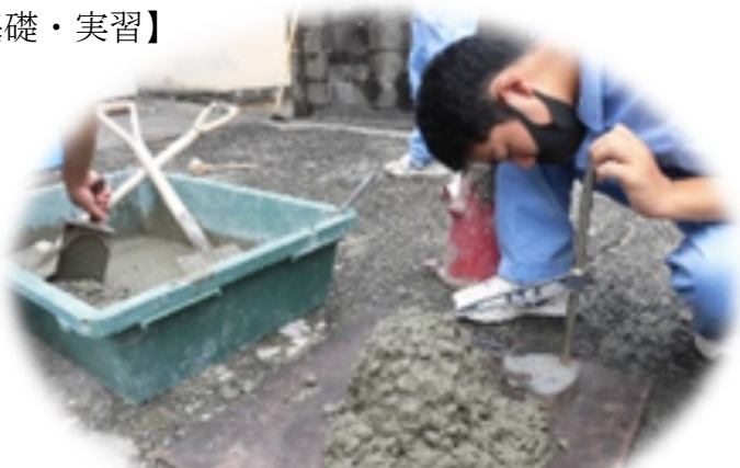
材料実習 (フレッシュコンクリートの品質試験)