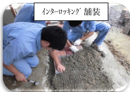
インターロッキング舗装